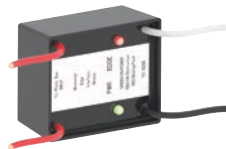
INTERFACE 002 (vendu séparément)